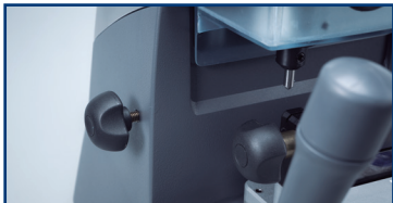
5 Blockierung der vertikalen Achse