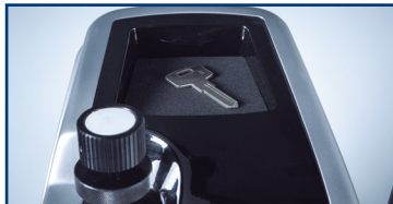
6 Im oberen Bereich Fach für Werkzeuge