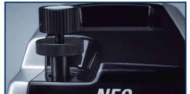
8 Präzise und einfache Einstellung des Tasters.